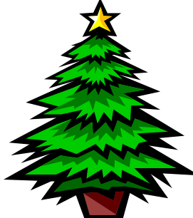
A CHRISTMAS TREE