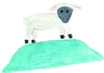
LIMESTOCK (THAT'S HIS NAME)